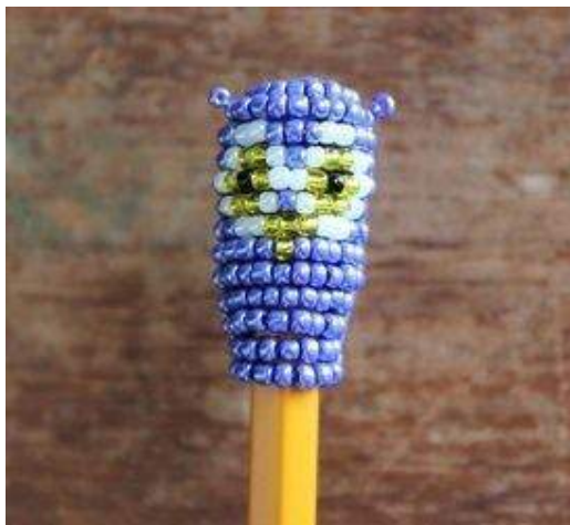
Схема плетения совы.

Сегодня мы с вами будем плести сову на карандаш в технике объемного плетения.