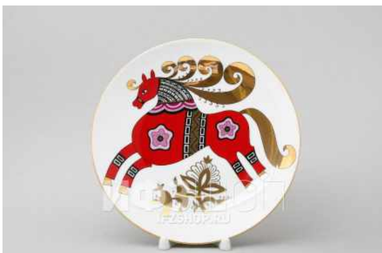
Красный стилизованный конь в народном стиле.