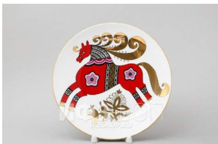
Красный стилизованный конь в народном стиле.